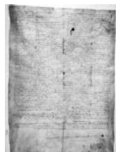
Pariatge de 1278